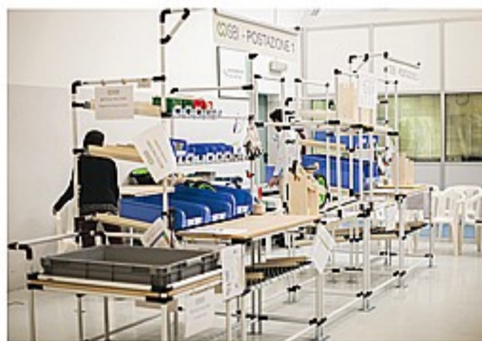
Linea simulata. Una delle attività proposte da SFIDA 4.0

"Integrazione tecnologica, integrazione ufficio-fabbrica ed efficienza globale sono i pilastri della nostra SFIDA, al centro della quale ci sono le risorse umane - aggiunge Losio -. La mission del progetto risiede proprio nello sviluppo delle nuove competenze, hard skill e